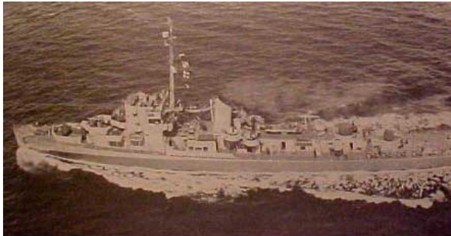
U.S.S. ELDRIDGE (DE 173), September 12, 1943

Le 5ème livre est écrit par un personnage qui a été un témoin de l'affaire Montauk car impliqué dedans, mais n'apporte rien à la compréhension de l'affaire; mais apporte des éléments d'un autre genre. Aussi si ce qui suit vous intéresse, vous pourrez vous faire une opinion plus précise ( et presque complète) uniquement à l'aide des 2 premiers livres.